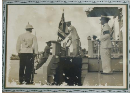
พระบาทสมเด็จพระปรมินทรมหาภูมิพลอดุลยเดช พระราชทานธงชัยเฉลิมพล เมื่อวันที่ ๑๓ ตุลาคม พ.ศ. ๒๔๙๗

พุทธศักราช ๒๕๐๓ ได้มีพระราชกฤษฎีกาแบ่งส่วนราชการกรมตำรวจ กระทรวงมหาดไทยใหม่ โดยตั้งกองบัญชาการศึกษาขึ้นและโอนการปกครองบังคับบัญชาโรงเรียนพลตำรวจภูธรทุกแห่ง รวมทั้งโรงเรียนพลตำรวจภูธร ๙ ซึ่งเดิมขึ้นอยู่กับกองบังคับการตำรวจภูธรภาค ๙ ให้ไปขึ้นอยู่ในสังกัดกองบัญชาการศึกษาและตั้งชื่อโรงเรียนใหม่นี้ว่า “โรงเรียนตำรวจภูธร ๔” แต่โรงเรียนยังตั้งอยู่ที่เดิม