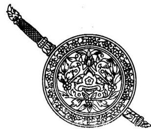
เป็นรูปพระแสงดาบเขนและโล่ซึ่งเป็นรูปวงกลมเส้นคู่ ๒ ชั้น วงนอกเป็นลายกนกประจำขามกับปู และวงในเป็นรูป หน้าสิงห์ที่มีลายกนกเปลวเพลิงประกอบ