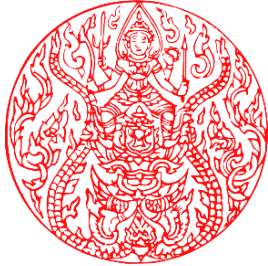
ภาพที่ ๒ พระราชลัญจกร พระครุฑพ่าห้องค์เดิม

ตราแผ่นดินนี้ ได้ใช้มาจนถึงรัชสมัยพระบาทสมเด็จพระมงกุฎเกล้าเจ้าอยู่หัวรัชกาลที่ ๖ เท่านั้น ก็มีพระราชประสงค์ให้ใช้ตรา “พระครุฑพ่า” เป็นตราแผ่นดินมาจนทุกวันนี้ ปัจจุบันหน่วยงานที่ใช้ตราแผ่นดินหรือตราอาร์มเป็นตราประจำหน่วยงานมีเพียงไม่กี่หน่วยงาน เพราะถือเป็นหน่วยงานที่จัดตั้งขึ้นในสมัยรัชกาลที่ ๕ เพียงตัดคำว่า “พิทักษ์สันติราษฎร์” ออกเว้นแต่สำนักงานตำรวจแห่งชาติเท่านั้น ที่ยังคงใช้ตราแผ่นดินหรือตราอาร์ม เป็นตราหน้าหมวกของข้าราชการตำรวจทุกนาย