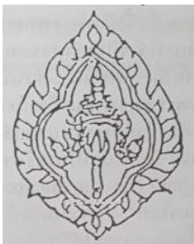
ภาพที่ ๖ ตราหน้าหมวกตำรวจรุ่นที่ ๒ (ตำรวจนครบาล) “เพชรารู้อ้อมด้วยกลีบกก”

ตราหน้าหมวกรุ่นที่ ๒ (ตำรวจนครบาล) และรุ่นที่ ๓ (ตำรวจภูธร) เริ่มใช้ในปี พ.ศ. ๒๔๕๘ โดยของตำรวจนครบาลเป็นรูปเพชรารู้อ้อมด้วยกลีบกก ในขณะที่ตำรวจภูธรในยุคนั้นใช้หน้าหมวกเป็นตราปทุมอุณาโลมบนพื้นสีแดง โดยมีบัวกนกสีน้ำตาลล้อมรอบ