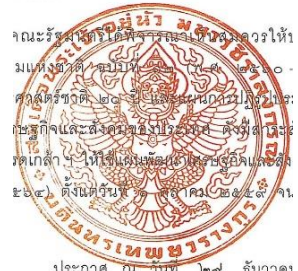
ภาพที่ ๔ พระราชลัญจกร พระครุฑพ่าห์ รัชกาลที่ ๑๐

ขอกล่าวเพิ่มเติมถึงตราหน้าหมวกของตำรวจที่เกิดขึ้นสืบเนื่องจากตราแผ่นดิน ซึ่งในรัชสมัยพระบาทสมเด็จพระจุลจอมเกล้าเจ้าอยู่หัว รัชกาลที่ ๕ ทรงพระกรุณาโปรดเกล้าฯ ให้ผูกตราประจำประเทศขึ้นเป็นครั้งแรก เมื่อ พ.ศ. ๒๔๑๖ ให้มีการเปลี่ยนแปลงตราหน้าหมวกใหม่เพื่อความเหมาะสมเรียกกันว่า “ปทุมอุณาโลม” โดยเรียกกันทั่วไปว่า “ตราแผ่นดิน” นั้นเอง ซึ่งพระองค์ทรงพระกรุณาโปรดเกล้าฯ ให้จำลองมาจากพระราชลัญจกรประจำพระองค์พระบาทสมเด็จพระพุทธยอดฟ้าจุฬาโลก รัชกาลที่ ๑ โดยตราดังกล่าวนี้เป็นพระราชลัญจกรประจำแผ่นดินใช้สำหรับประทับกำกับพระปรมาภิไธย หรือกำกับนามผู้สำเร็จราชการแทนพระองค์ แต่ตราหน้าหมวกนี้ใช้ได้เพียงไม่นาน ก็ทรงพระกรุณาโปรดเกล้าฯ ให้เลิกใช้ โดยมีพระราชประสงค์ให้ใช้เป็น “ตราอาร์ม” แบบของอังกฤษ ดังที่ปรากฏอยู่ที่หน้าหมวกตำรวจในปัจจุบัน ซึ่งจะกล่าวถึงรายละเอียดในลำดับถัดไป ช่วงนี้ขอไล่เรียงตราหน้าหมวกในแต่ละยุคสมัยให้ทุกท่านได้ทำความรู้จักกันก่อน เริ่มต้นที่ตราหน้าหมวกตำรวจรุ่นที่ ๑ ในสมัยรัชกาลที่ ๔