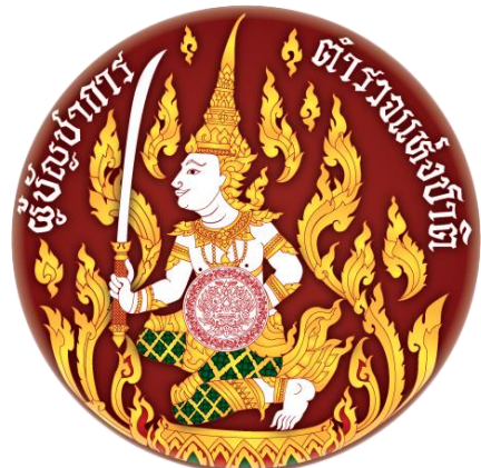
ภาพที่ ๑๗ ตราประจำตำแหน่งผู้บัญชาการตำรวจแห่งชาติ

หมายเหตุ เมื่อวันที่ ๑๗ กุมภาพันธ์ พ.ศ. ๒๔๗๕ ได้มีประกาศให้เปลี่ยนตราตำแหน่งในกรมตำรวจจากเดิม ให้ใช้ชื่อใหม่เป็น “อธิบดีกรมตำรวจ” ส่วนรูปตราคงเดิม ต่อมาเมื่อมีพระราชกฤษฎีกาโอนกรมตำรวจ กระทรวงมหาดไทย ไปจัดตั้งเป็นสำนักงานตำรวจแห่งชาติ เมื่อ ๑๗ ตุลาคม พ.ศ. ๒๕๔๑ ส่งผลให้ชื่อ “กรมตำรวจ” เปลี่ยนเป็น “สำนักงานตำรวจแห่งชาติ” ตำแหน่ง “อธิบดีกรมตำรวจ” จึงเปลี่ยนเป็น “ผู้บัญชาการตำรวจแห่งชาติ”