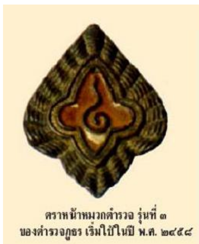
รูปภาพที่ ๗ ตราหน้าหมวกตำรวจรุ่นที่ ๓ (ตำรวจภูธร) “ปทุมอุณาโลมบนพื้นสีแดง โดยมีบัวกนกสีน้ำตาลล้อมรอบ”