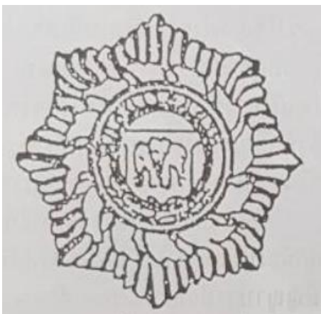
ภาพที่ ๕ ตราหน้าหมวกตำรวจรุ่นที่ ๑ (สมัยรัชกาลที่ ๔ ) “ช้างสามเศียร ยืนในตราอาร์ม” ประทวน ทำด้วยโลหะสีเงิน เป็นรูปกงจักรวางอยู่บน กลีบบัวหงาย ภายในเป็นรูปช้างสามเศียร ลัญญาบัตร เพิ่มพระมหาพิชัยมงกุฎอยู่ด้านบน

ขอกล่าวเพิ่มเติมถึงตราหน้าหมวกของตำรวจที่เกิดขึ้นสืบเนื่องจากตราแผ่นดิน ซึ่งในรัชสมัยพระบาทสมเด็จพระจุลจอมเกล้าเจ้าอยู่หัว รัชกาลที่ ๕ ทรงพระกรุณาโปรดเกล้าฯ ให้ผูกตราประจำประเทศขึ้นเป็นครั้งแรก เมื่อ พ.ศ. ๒๔๑๖ ให้มีการเปลี่ยนแปลงตราหน้าหมวกใหม่เพื่อความเหมาะสมเรียกกันว่า “ปทุมอุณาโลม” โดยเรียกกันทั่วไปว่า “ตราแผ่นดิน” นั้นเอง ซึ่งพระองค์ทรงพระกรุณาโปรดเกล้าฯ ให้จำลองมาจากพระราชลัญจกรประจำพระองค์พระบาทสมเด็จพระพุทธยอดฟ้าจุฬาโลก รัชกาลที่ ๑ โดยตราดังกล่าวนี้เป็นพระราชลัญจกรประจำแผ่นดินใช้สำหรับประทับกำกับพระปรมาภิไธย หรือกำกับนามผู้สำเร็จราชการแทนพระองค์ แต่ตราหน้าหมวกนี้ใช้ได้เพียงไม่นาน ก็ทรงพระกรุณาโปรดเกล้าฯ ให้เลิกใช้ โดยมีพระราชประสงค์ให้ใช้เป็น “ตราอาร์ม” แบบของอังกฤษ ดังที่ปรากฏอยู่ที่หน้าหมวกตำรวจในปัจจุบัน ซึ่งจะกล่าวถึงรายละเอียดในลำดับถัดไป ช่วงนี้ขอไล่เรียงตราหน้าหมวกในแต่ละยุคสมัยให้ทุกท่านได้ทำความรู้จักกันก่อน เริ่มต้นที่ตราหน้าหมวกตำรวจรุ่นที่ ๑ ในสมัยรัชกาลที่ ๔