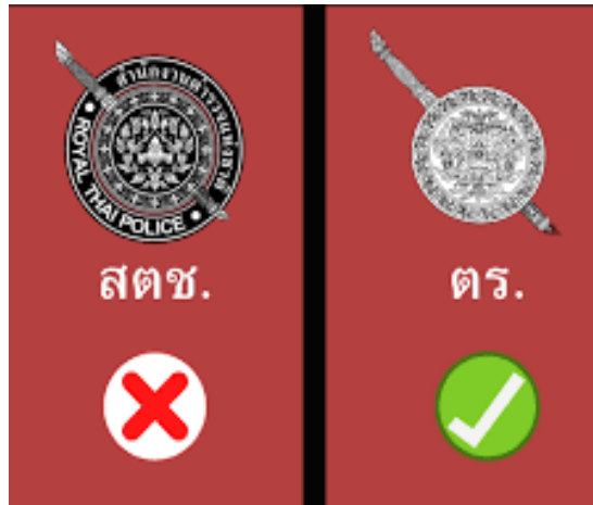
ภาพที่ ๑๔ การใช้ตราสัญลักษณ์โล่เขนที่ถูกต้อง

ปัจจุบันสำนักงานตำรวจแห่งชาติ มีเครื่องหมายราชการ เป็นรูปพระแสงดาบเขนและโล่ ซึ่งเป็นรูปวงกลมเส้นคู่สองชั้น วงนอกเป็นลายพรรณพฤษกา วงในเป็นลายใบเทศผูกกลายเป็นรูปหน้าสิงห์หรือหน้ายักษ์ เรียกว่าจตุรมุข ตามธรรมเนียมโบราณที่แกะสลักรูปหน้ายักษ์จตุรมุข ไว้บนหน้าบันประตู ทั้งสี่ทิศของปราสาทหิน ด้วยความเชื่อว่า เป็นผู้พิทักษ์ทวารเข้า-ออก ปกป้องคุ้มครองและขจัดสิ่งชั่วร้าย ส่วน "ดาบ" คาดติดอยู่ในปลอก มีลวดลายกนก ทั้งนี้สัญลักษณ์ไม่จำกัดสีและขนาด