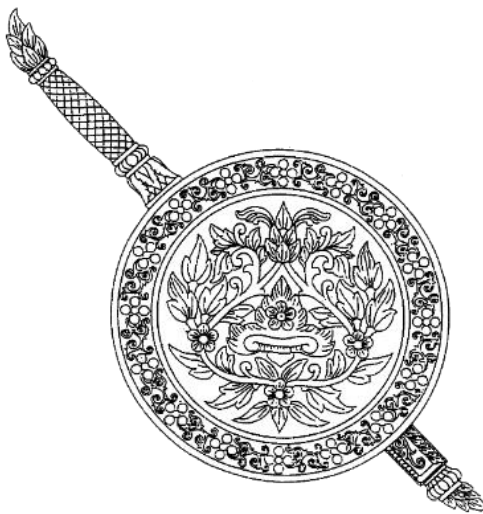
ภาพที่ ๑๕ พระแสงดาบเขนและโล่

โดยเครื่องหมายดังกล่าวถูกกำหนดไว้ในประกาศสำนักนายกรัฐมนตรี เรื่อง กำหนดภาพเครื่องหมายราชการตามพระราชบัญญัติเครื่องหมายราชการ พ.ศ. ๒๔๘๒ (ฉบับที่ ๑๖๘) ลงวันที่ ๒๙ มิถุนายน พ.ศ. ๒๕๔๔ ซึ่งประกาศในราชกิจจานุเบกษา เล่ม ๑๑๘ ตอนที่ ๘๐ ง หน้า ๔ วันที่ ๔ ตุลาคม พ.ศ. ๒๕๔๔ และได้มีการระบุการใช้อยู่ในระเบียบสำนักงานตำรวจแห่งชาติว่าด้วยประมวลระเบียบการตำรวจไม่เกี่ยวกับคดี ลักษณะที่ ๕๗ ลักษณะเบ็ดเตล็ด (ฉบับที่ ๑๔) พ.ศ. ๒๕๕๕ อีกด้วย