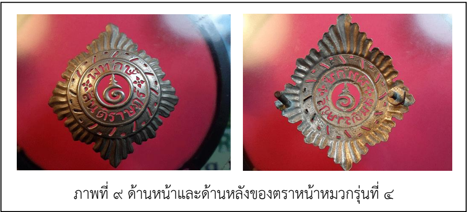
ภาพที่ ๙ ด้านหน้าและด้านหลังของตราหน้าหมวกรุ่นที่ ๔