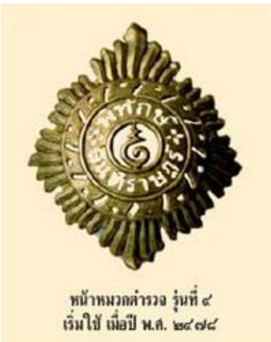
ภาพที่ ๘ ตราหน้าหมวกรุ่นที่ ๔ (สมัยรัชกาลที่ ๘) สำหรับหน้าหมวกตำรวจ รุ่นที่ ๔ เริ่มใช้ในปี พ.ศ. ๒๔๗๘ เป็นโลหะรูปสี่เหลี่ยมรี มีปทุมอุณาโลมอยู่กลางกงจักร โดยรอบนอกกงจักรมีลายเพลิงส่วนในกงจักรมีอักษร “พิทักษ์สันติราษฎร์”