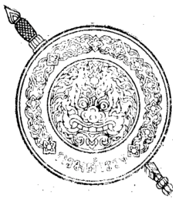
เป็นรูปพระแสงดาบเขนและโล่ ซึ่ง เป็นรูปวงกลม เส้นคู่ ๒ ชั้น วงนอก มีลายกนก และมีคำว่า "กรมตำรวจ" อยู่ เบื้องล่าง วงใน มีรูปหน้าสิงห์อยู่ภายในกนกเปลว